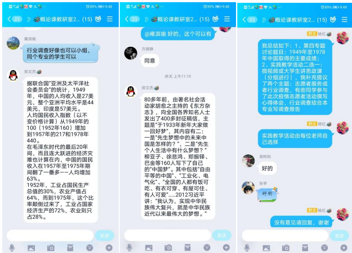
（“概论课”教研室集体备课会：讨论）