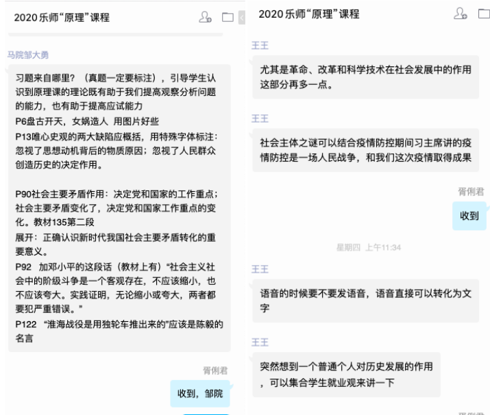
(“原理”课集体备课会)