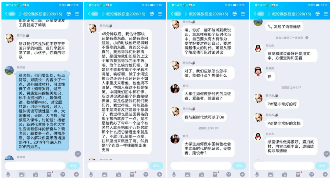
（“概论”课教研室开展本学期第七次网络集体备课会）